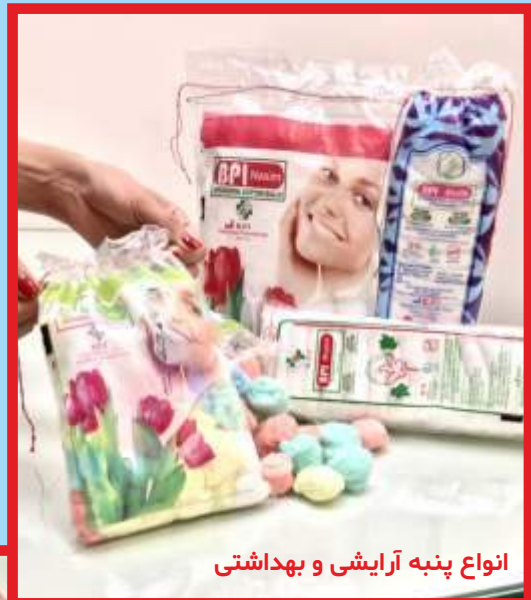
انواع پنبه آرایشی و بهداشتی